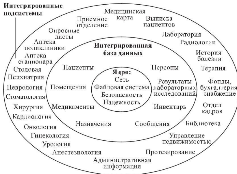
Рис. 2. Функциональная интеграция в рамках МИС

Пример взаимозависимых систем — госпитальная информационная система и PACS-система. Для того чтобы сохранить архивную визуальную информацию с результатами какого-либо диагностического исследования, PACS-система должна каким-то образом идентифицировать это исследование и пациента, для которого оно проводится. Демографическая информация о каждом пациенте, так же как спецификации типов диагностических исследований, уже имеются в базе данных МИС, и дублирование их в базе данных PACS может привести, во-первых, к избыточности информации, а во-вторых, к необходимости контролировать непротиворечивость информации во всех зависимых подсистемах для МИС. Так, если демографическая информация пациента меняется (например, меняется фамилия), МИС должна была бы сообщить об изменениях PACS, иначе идентификация данного пациента в PACS становится невозможной. Следовательно, было бы более разумно устанавливать соответствия (ссылки) между информацией в базах данных этих двух систем, чтобы обеспечивать динамическое представление информации.