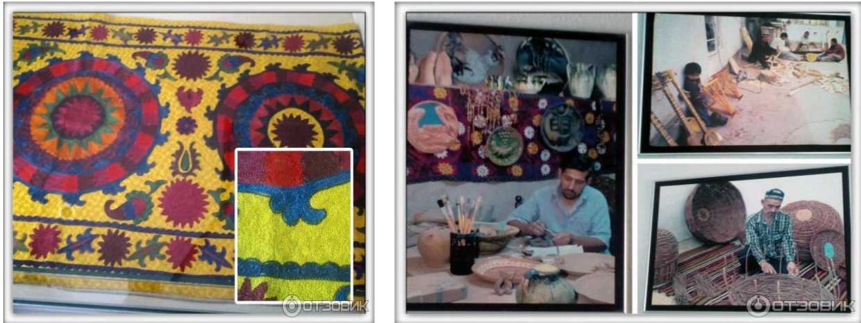
А так же современные изделия из Керамической школы г. Китаба: