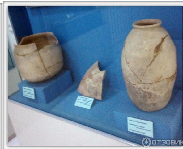
Шкатулка из древнего города Еркүрган: