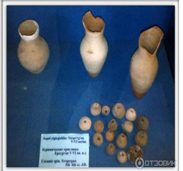
Что удивило, что в то время уже были свистульки.