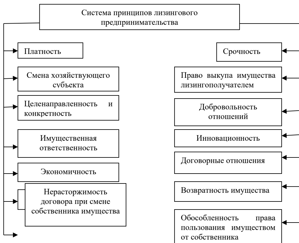
Рис.1. Систематизация принципов и особенностей лизинговых отношений 10

На наш взгляд, как экономическая категория, он имеет свое собственное содержание и различные формы проявления. Лизинговая форма предпринимательства основывается на системе принципов, общих, частных и особенных ее свойств, внешних проявлений, которые необходимо учитывать в практической деятельности (рис.1).