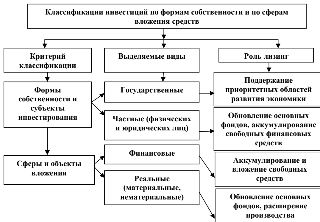
Рис. 1 Классификации инвестиций по формам собственности и по сферам вложения средств 3

Основное содержание лизинга сводится к инвестированию временно свободных или привлеченных финансовых ресурсов в долгосрочные активы, передаваемые во временное пользование. Лизинг можно рассматривать как один из источников финансирования инвестиций наряду с собственными средствами хозяйствующих субъектов, продажей неиспользуемых активов, бюджетными и внебюджетными централизованными фондами, кредитами банков, эмиссией ценных бумаг - акций и облигаций, а также средствами иностранных инвесторов. С другой стороны, лизинг - это и направление инвестирования временно свободных финансовых ресурсов. В литературе встречаются различные классификации инвестиций (рис.1) приведены некоторые из них, важные для понимания роли и места лизинга.