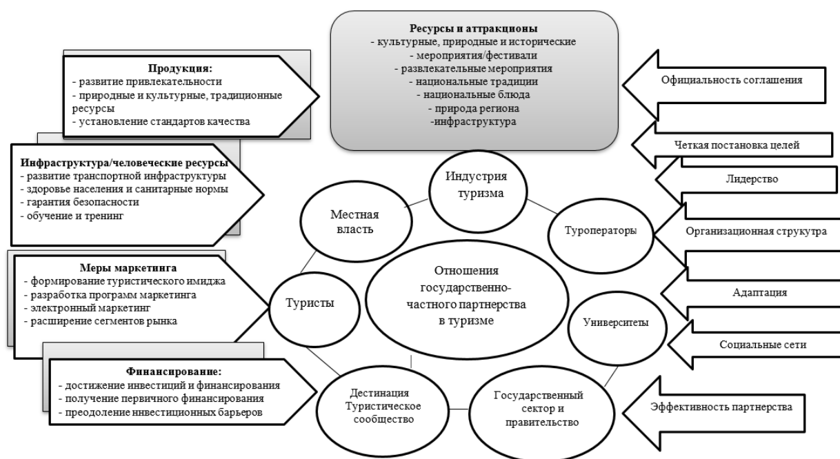
Рисунок 2-Концептуальная модель государственно-частного партнерства в стратегическом развитии туризма в регионе

Действительно, из-за экономических и финансовых кризисных явлений взаимные отношения государства и частных отраслей имеют важное значение в национальном и мировом масштабе. Таким образом, предложенную модель можно воспринимать в качестве крохотного шага в деле изучения отношений государственно-частного партнерства в региональном туризме в последующих исследованиях. Еще одна из своеобразных черт данной модели определяется тем, что каждый регион должен быть эффективно использован, исходя из его туристического потенциала.