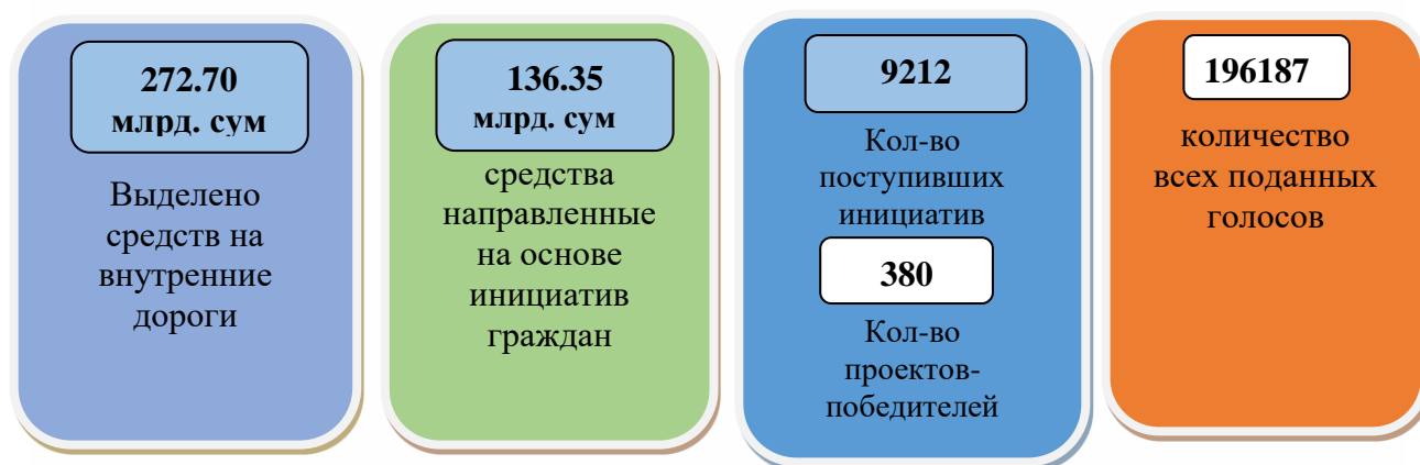
Рис. 3. Объёмы средств, выделенных на ремонт внутренних дорог в рамках программы «Моя дорога»

Одним из первых активных шагов по дальнейшему внедрению механизмов инициативного бюджетирования для совершенствования дорожной отрасли республики послужило принятое постановление Президента Республики Узбекистан от 22 сентября 2021 года № ПП-5250 «О мерах по дальнейшему расширению финансирования мероприятий, сформированных на основе общественного мнения посредством информационного портала «Открытый бюджет»». В соответствии с данным нормативно-правовым актом установлено введение нового порядка, предусматривающего начиная с 1 января 2022 года 50 процентов средств, выделяемых на ремонт местных внутренних дорог в параметрах бюджетов районов и городов, направляется на ремонт внутренних дорог, определенных на основе общественного мнения посредством информационного портала «Открытый бюджет».