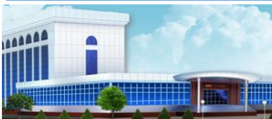
Комитет по автомобильным дорогам

данные о движении средств, направляемых на строительство, реконструкцию, ремонт и содержание автомобильных дорог