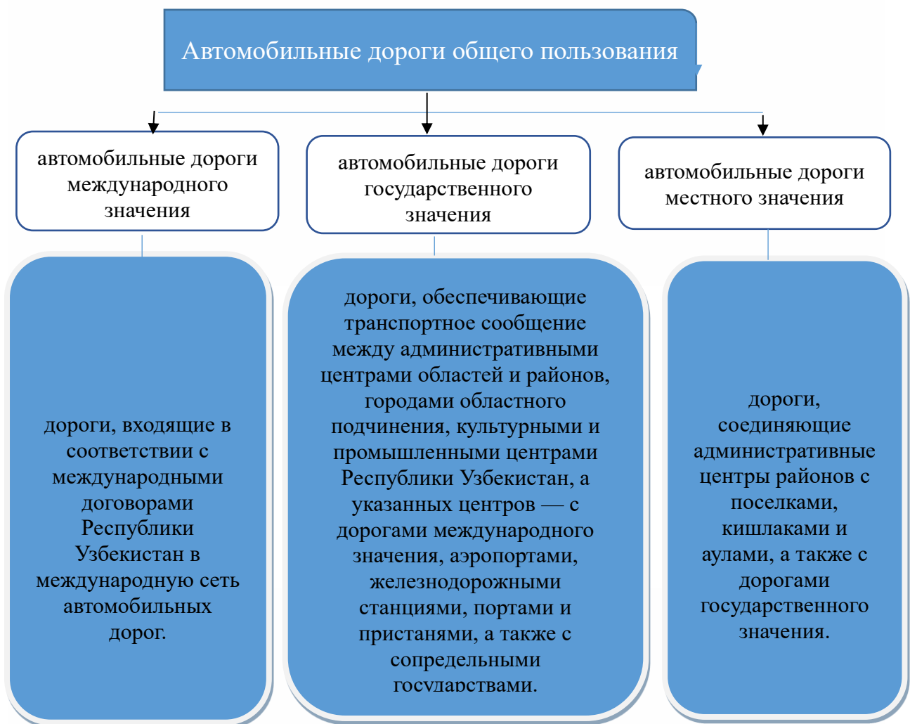
Рис. 2. Классификация автомобильных дорог общего пользования

В тоже время автомобильные дороги общего пользования классифицируются следующим образом: