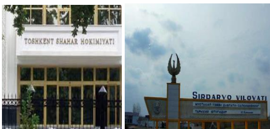
Совет Министров Республики Каракалпакстан, хокимияты областей и города Ташкента

информация о дорожно — строительных работах, проводимых на объектах строительства, реконструкции и ремонта автомобильных дорог, в том числе связанных с автомобильными дорогами общего пользования