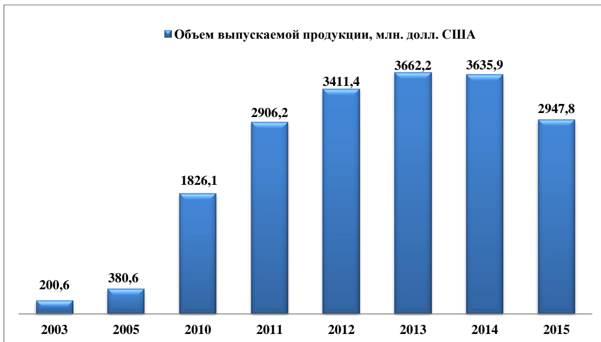
Рисунок 2 - Динамика объёма выпускаемой продукции в Нахчыванской Автономной Республике за 2003-2015 годы, млн. долл. США.

Можно отметить, что за 2003-2015 годы объём выпускаемой продукции в Нахчыванской Автономной Республике вырос почти в 15 раз и по итогам 2015 года составил 2947,8 млн. долл. США. Однако из-за усиления негативных последствий мировых финансовых кризисов и влияния глобальных экономических процессов за последние годы наблюдается снижение объёма