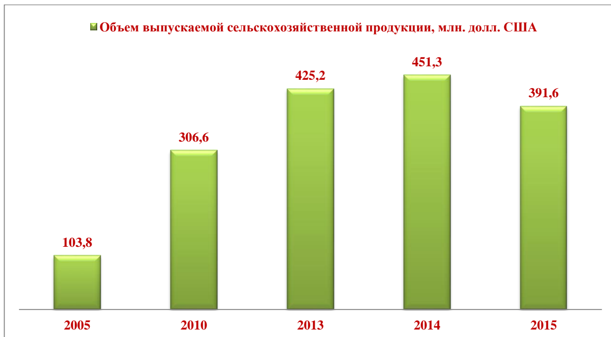
Рисунок 4 - Динамика объёма выпускаемой сельскохозяйственной продукции в Нахчыванской Автономной Республике за 2005-2015 годы, млн. долл. США.

сельскохозяйственной продукции в Нахчыванской Автономной Республике за 2005-2015 годы.