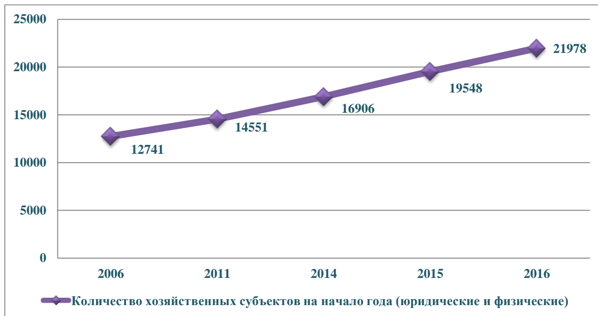
Рисунок 5 - Количество хозяйственных субъектов (юридические и физические) в Нахчыванской Автономной Республике за 2006-2016 годы, на начало года.

391,6 млн. долл. США. На Рисунке 5 отражена графическая кривая по динамике количества хозяйственных субъектов (юридических и физических) в Нахчыванской Автономной Республике за 2006-2016 годы, на начало года.