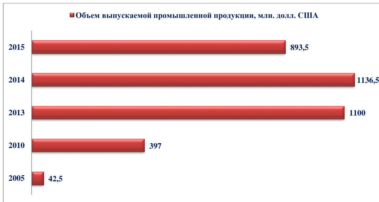
Рисунок 3 - Динамика объёма выпускаемой промышленной продукции в Нахчыванской Автономной Республике за 2005-2015 годы, млн. долл. США.

продукции в долл. выражении, так как курс национальной валюты – манат по отношению к доллару США за последние 2 года снизился свыше 2 раз. На Рисунке 3 дана динамика объёма выпускаемой промышленной продукции в Нахчыванской Автономной Республике за 2005-2015 годы.